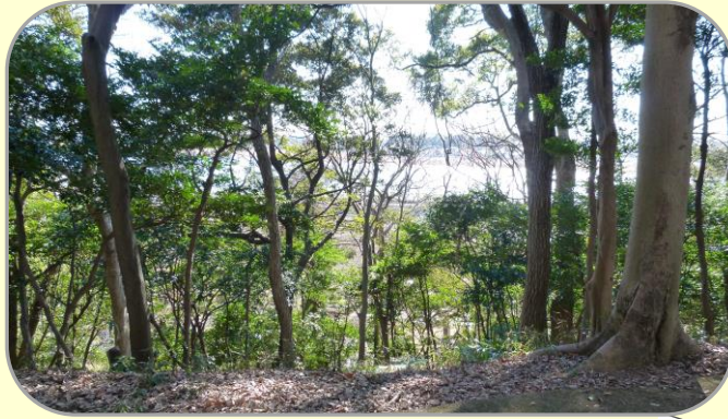
12 根戸船戸緑地から見える手賀沼