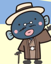
手賀沼のうなぎちゃん

我孫子のいろいろ八景歩き 白山のまちなみと船戸の森・湧き水の小径コース 発行 平成 28 年 10 月 第 1 刷発行 令和 3 年 2 月 第 3 刷発行 発行者 我孫子市都市計画課景観推進室 ☎04-7185-1111 (代表) 企画・編集 我孫子の景観を育てる会