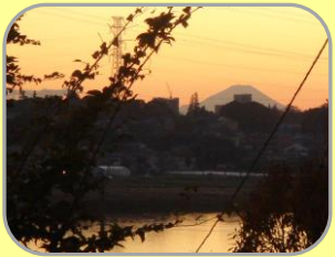
富士見坂から見える富士山