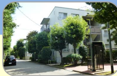
7 白山グリーンタウン