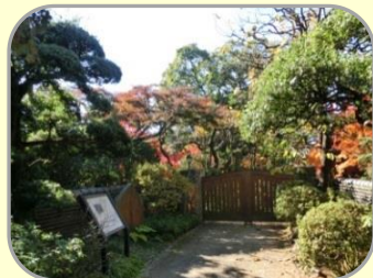
11 旧武者小路実篤邸跡